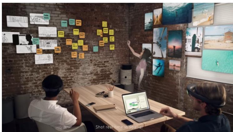
© Spatial, la startup qui permet d'organiser des réunions en réalité augmentée

La start-up a développé une plateforme de communication multi-utilisateurs utilisant la réalité augmentée. Le logiciel permet ainsi aux utilisateurs de se retrouver dans un espace de travail unique et ce, même si certains des collaborateurs se trouvent à l'autre bout du monde. Une visioconférence version « augmentée » où chacun peut ainsi échanger comme si les employés étaient dans la même pièce sous forme d'hologramme pour les absents. Un environnement de travail immersif où les participants ont pour seul impératif de porter un casque de AR et qui s'adapte également sur des supports plus classiques [tablettes, smartphone ou ordinateur].