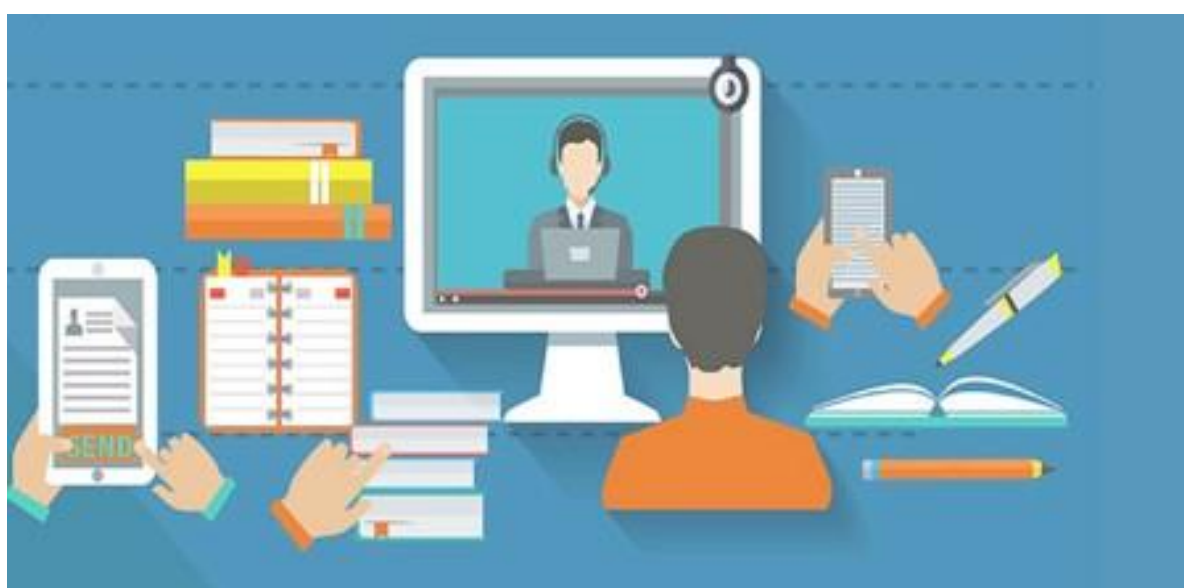
Enseignement à distance, classe virtuelle.