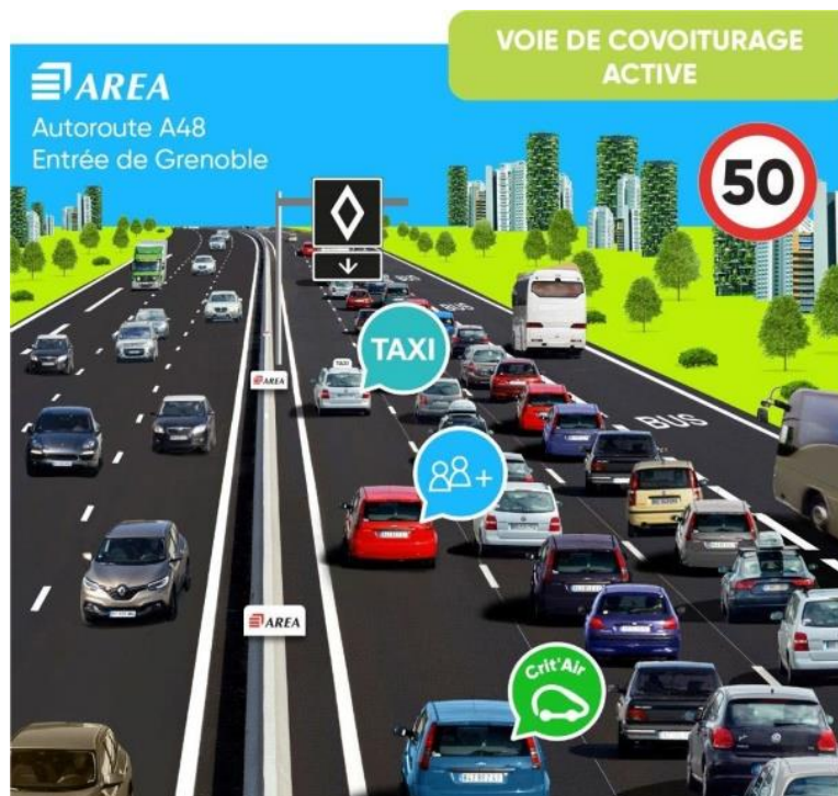
Schéma de la voie réservée au covoiturage sur l'A48.

Selon le code de la route, sans autorisation, un véhicule circulant sur cette voie lorsqu'elle est active s'expose à une amende de 135 €.